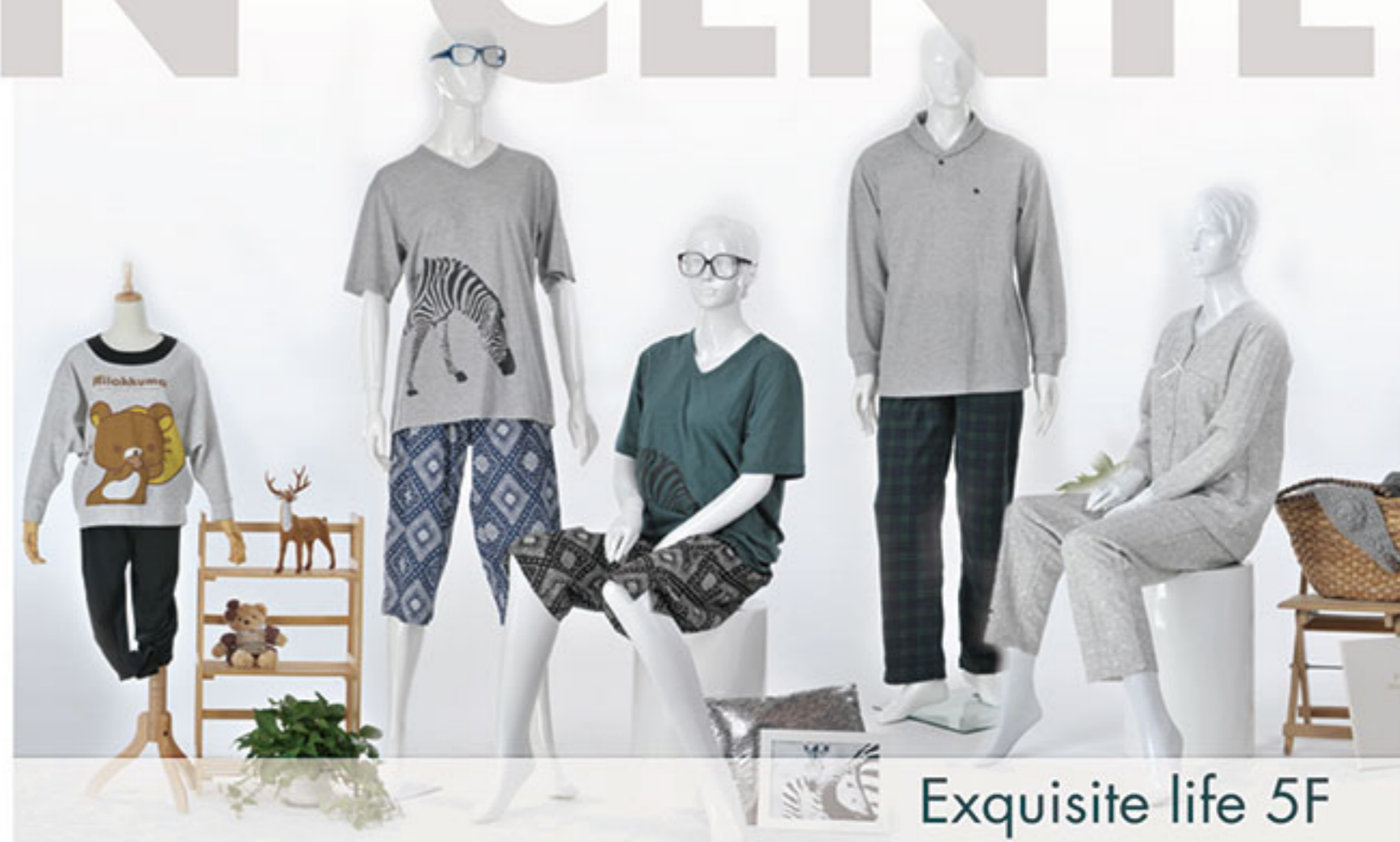
Exquisite life 5F