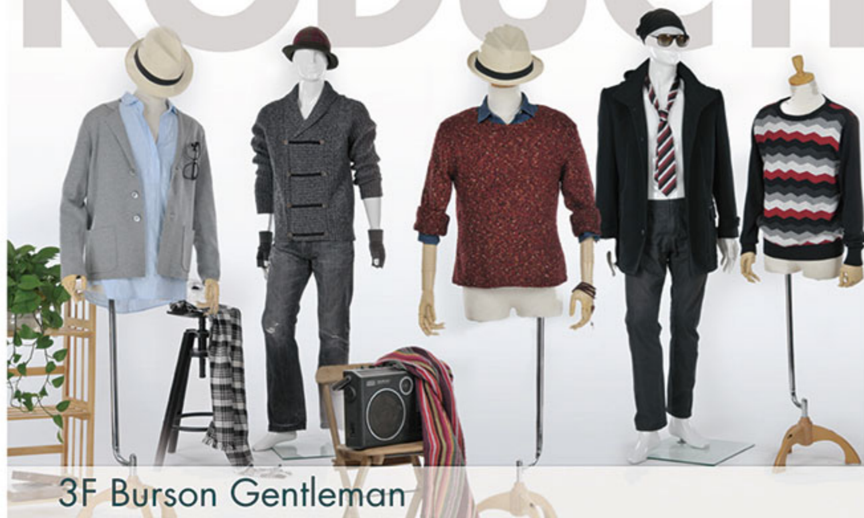
3F Burson Gentleman