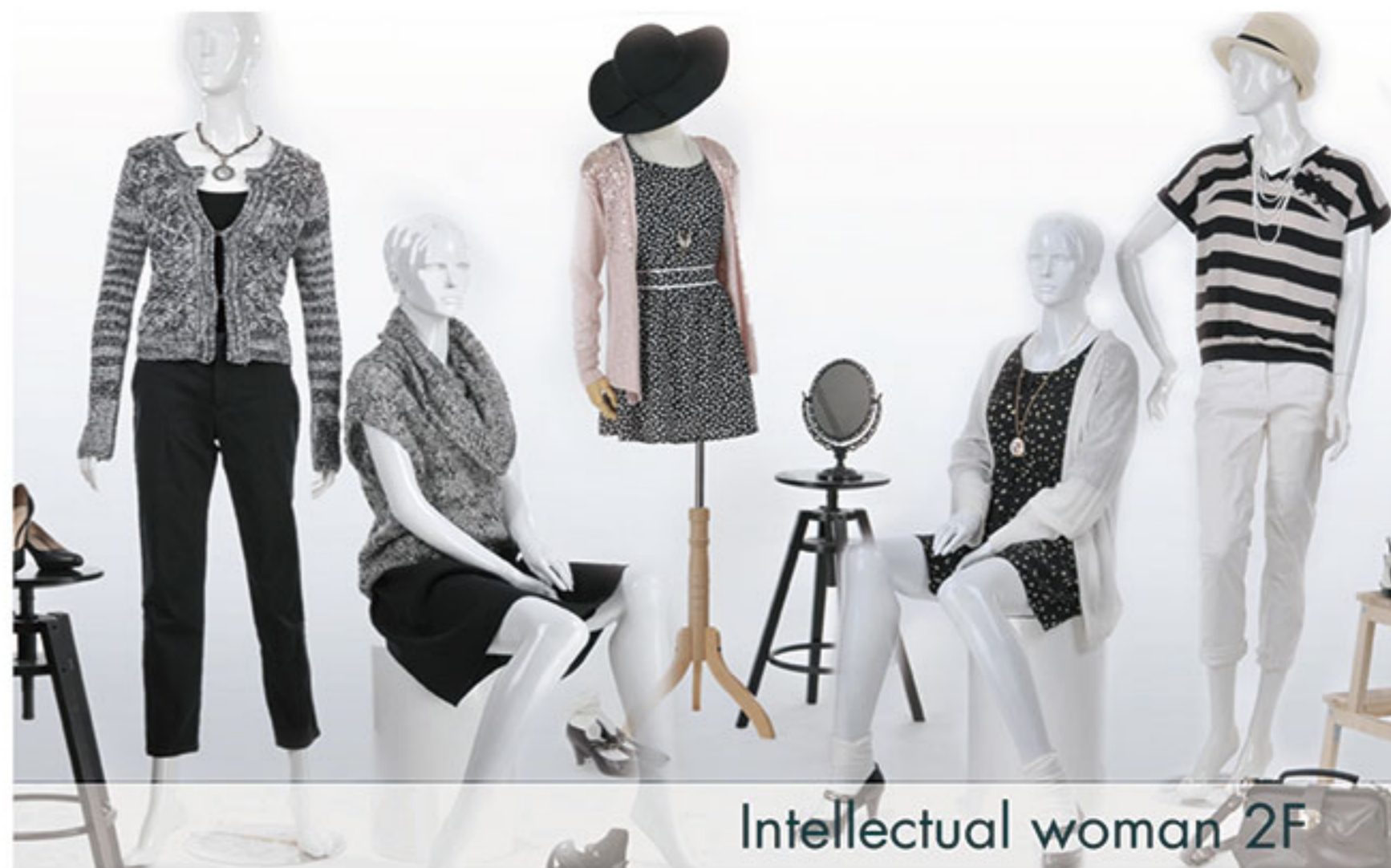
Intellectual woman 2F