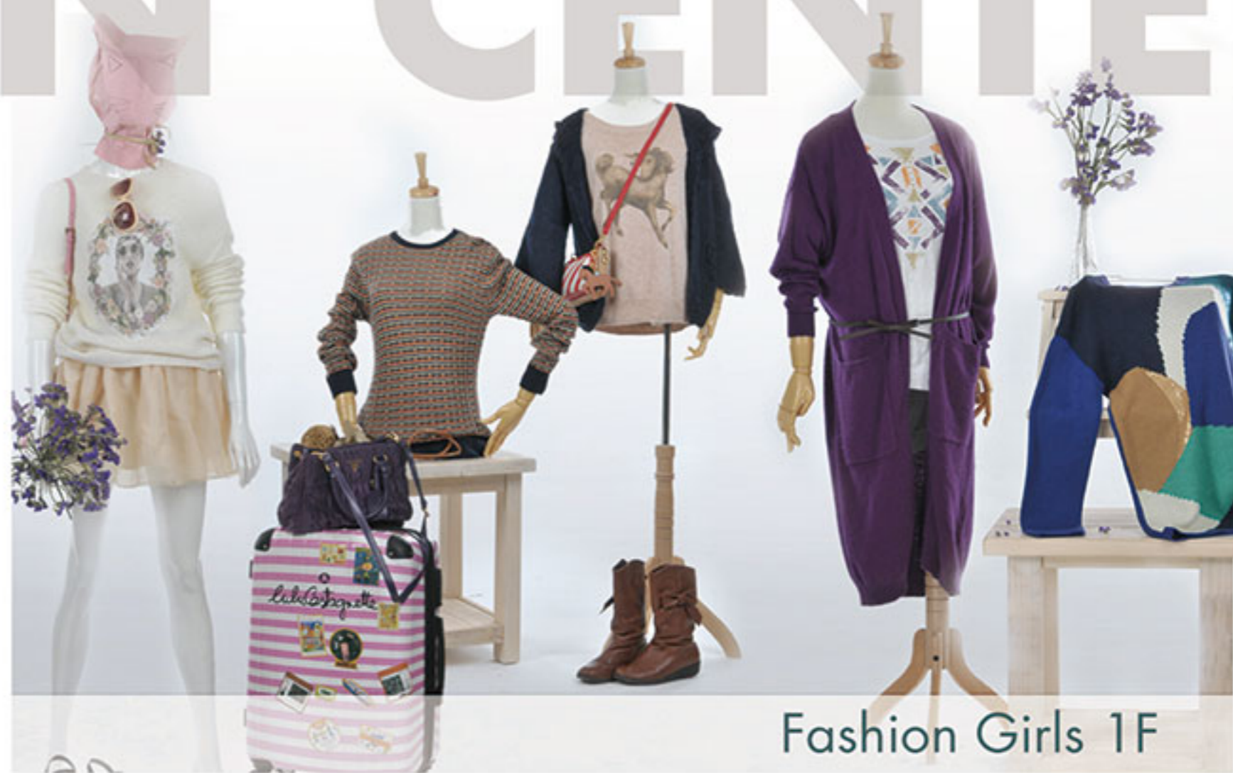
Fashion Girls 1F