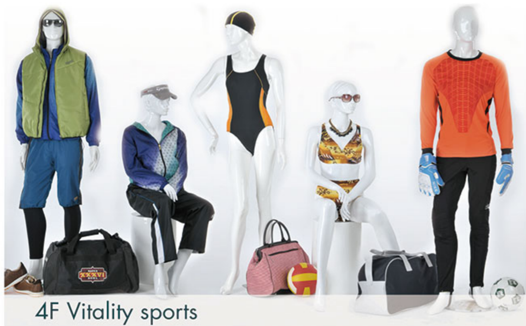
4F Vitality sports