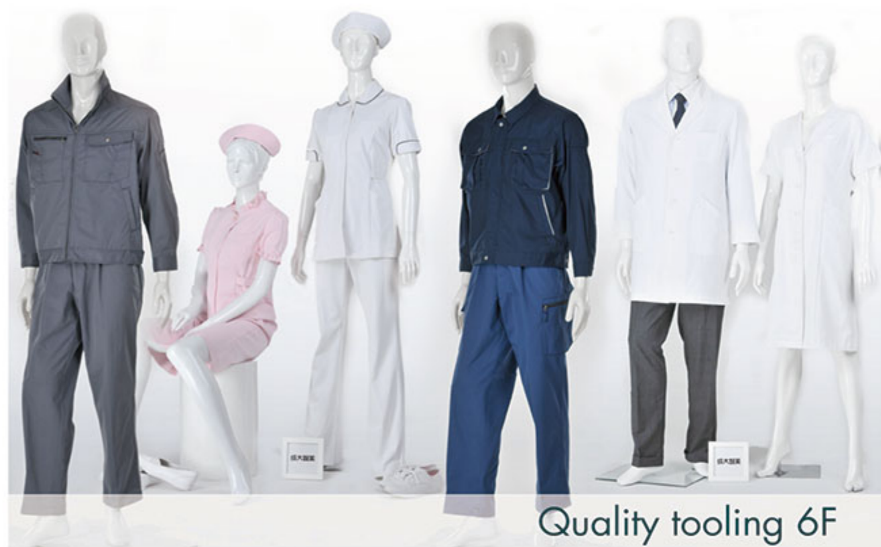
Quality tooling 6F